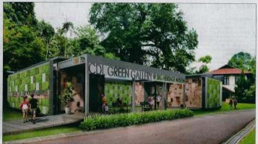
An artist's impression of the CDL Green Gallery in the Botanic Gardens. To be built using concrete made from the hemp plant, the 314 sq m solar-powered gallery will begin by showcasing half a century of "greening" Singapore, with exhibits changed once or twice a year.

It will be built by City Developments Limited (CDL), using con-