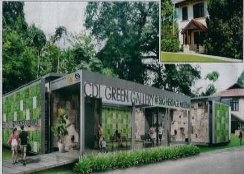
GALERI CERMINAN MATA: Berlokasi sebesar tiga hingga empat unit floor HD3, galeri ini akan memperkayakan usaha memajukan Singapura sepanjang masa sebagai bandar hijau. (Setera kanan) Museum Warisan SBG yang bakal diperolehi sebagai ciri interaktif bagi membolehkan pengunjung mempelajari sejarah dan warisan kebun bunga.

"Dengan sejarah kaya sepanjang lebih 150 tahun, Kebun Bunga Singapore telah memainkan peranan penting dalam memajukan Singapura dan perkhidmatan tarikan, juga kebun.